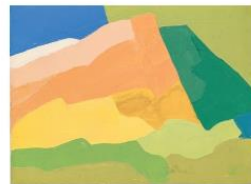
Untitled, v. 1980, huile sur toile, 30,3 x 40,5 cm.