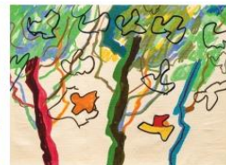
Au matin, 2017, tapisserie basse lisse 100% laine, 3 ex., 143 x 200 cm.