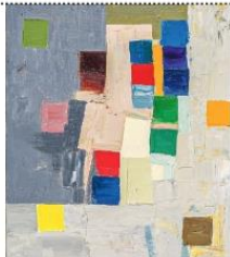
Untitled, 1970, h/t, 37 x 45 cm VILLENEUVE-D'ASCQ, LAM. © ETEL ADNAN 2019, N. DEWITTE/LAM.

Comme dans un kaléidoscope, les couleurs s'attirent, s'aimantent. Leurs surfaces plates et maigres rayonnent pourtant, charnelles mais sereines. La palette est vive et tendre à la fois, du jaune aux différents roses, du bleu layette au bleu lavande, des verts printaniers aux bruns chauds. Chaque teinte est à sa place, étalée au couteau ou à la spatule, sans jamais se mélanger. Bien qu'elle ne soit pas mystique, l'artiste part à la recherche de la moindre par-