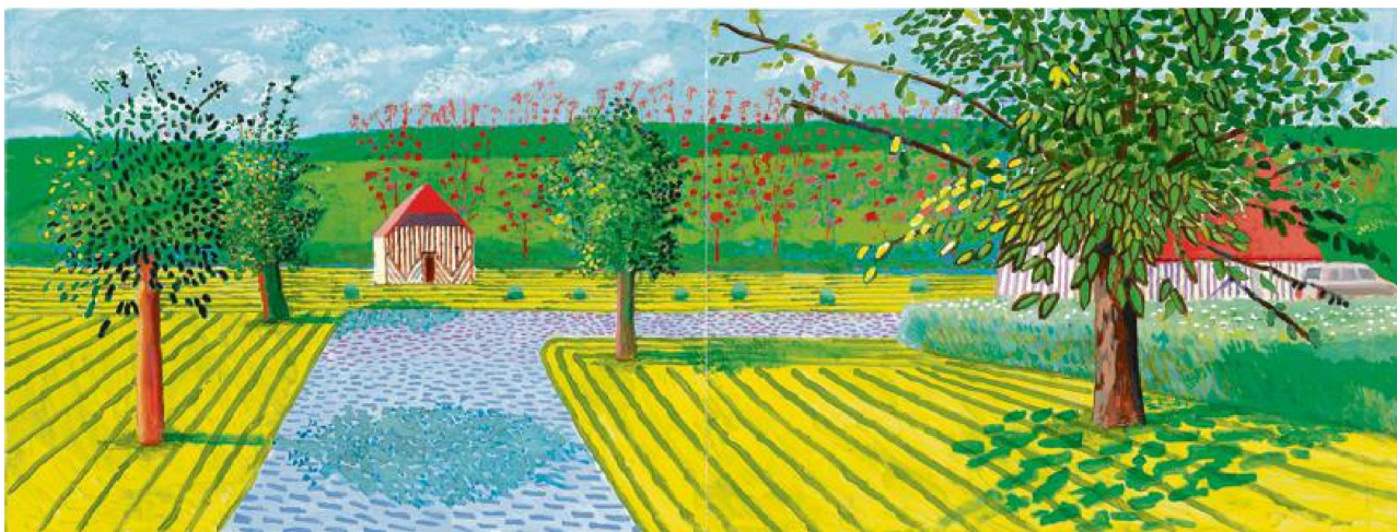
«The Entrance» (2019), de David Hockney, acrylique sur deux toiles (91,44 cm x 121,92 cm chacune, soit 91,44 cm x 243,84 cm au total).